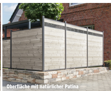
Oberfläche mit natürlicher Patina