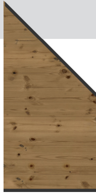
Art. 3781 SYSTEM HOLZ THERMO massiv Anschluss-Set, 91 x 184 auf 94 cm