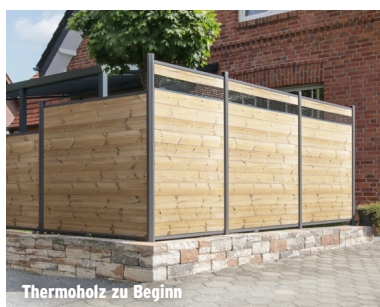
Thermoholz zu Beginn