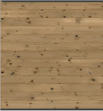
Art. 3780 SYSTEM HOLZ THERMO massiv Zaunfeld-Set, 178 x 184 cm